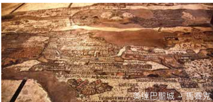
美達巴聖城 - 馬賽克

是日前往石器時代的人類聚居之處「美達巴聖城」，接著參觀希臘東正教聖佐治大教堂內的馬賽克地圖，之後前往摩西去世之地「尼波山」，觀賞銅蛇掛杆。繼而往烏姆拉斯古城，古城結合羅馬、拜占庭、早期伊斯蘭教建築風格，團友可到聖斯提芬教堂，參觀約旦規模最大及最完整的馬賽克地圖，之後往伯特拉。