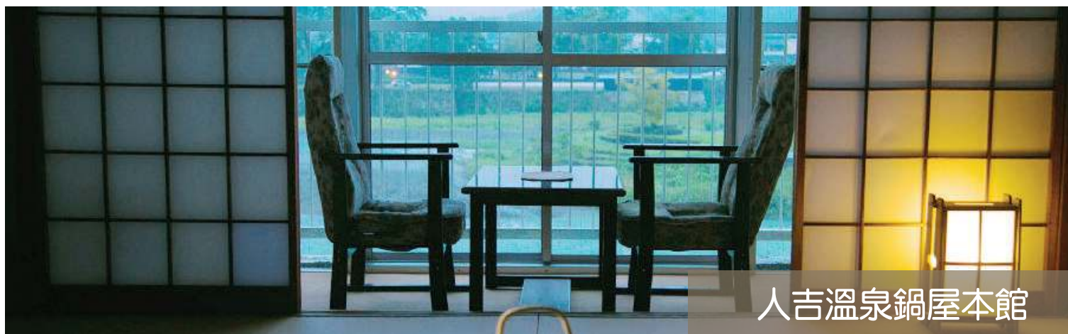
人吉溫泉鍋屋本館

鹿兒島城山酒店座落在海拔108公尺的城山高台上，可眺望鹿兒島著名的櫻島火山和錦江灣。酒店內設有露天展望溫泉，碳酸氫泉水是取自地下一千米，客人能一邊在被譽為薩摩之湯的泉水浸泡溫泉，一邊觀賞櫻島以及鹿兒島市區景色，獲得世界各地顧客的一致好評。