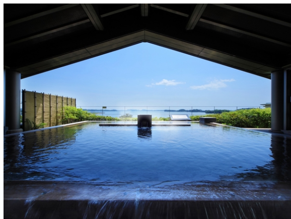
松島一の坊 - 絕景の露天風呂

住宿：Hotel Metropolitan Sendai 或同級酒店 (可自費提升入住松島一の坊 / 作並溫泉 Salon 一の坊)