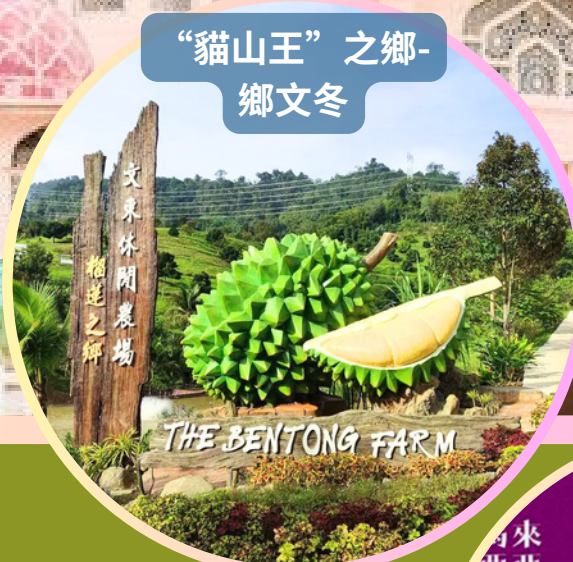
“貓山王”之鄉- 鄉文冬