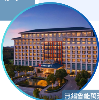
無錫魯能萬豪酒店