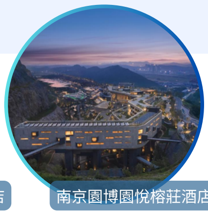
南京園博園悅榕莊酒店