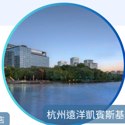
杭州遠洋凱賓斯基酒店