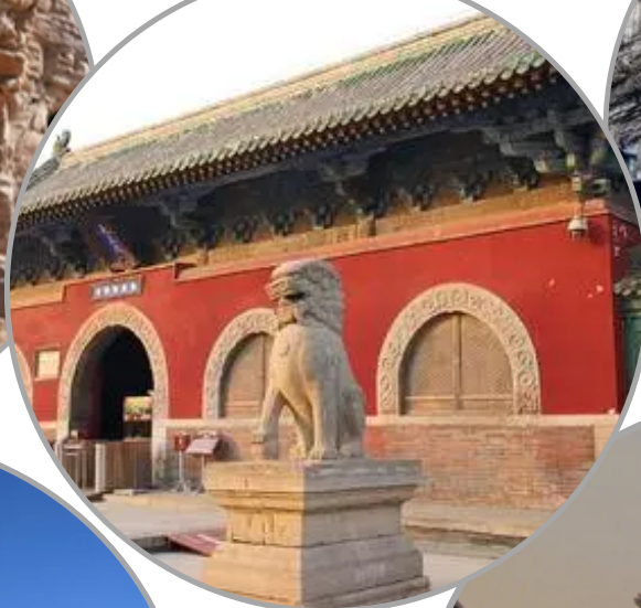
河北石家莊隆興寺