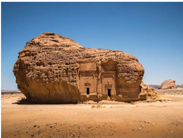
黑格拉-先知之城 :此城在公元前六世紀由納巴泰人所建的巨大陵墓群，全部用微紅色的沙岩及石頭而建，形狀有如太空船，磨菇頭，房舍內外精細的雕刻，鬼斧神工，堪稱一絕。