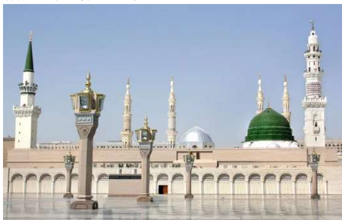
先知清真寺 :坐落於沙特阿拉伯麥地那-白尼·納加爾區，始建於公元622年，是伊斯蘭教創始人、先知穆罕默德親自參與建造的。經多次擴建，先知寺目前成為一座龐大的建築羣，佔地面積