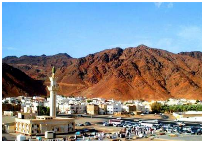
烏胡德山 :是沙特境內麥地那東北部的一座山。海拔約1,077公尺，是由先知穆罕默德領導的大軍與麥加軍隊戰鬥的地方，也是主要的朝聖地之一。不遠有一處烏胡德英烈墓，85名戰死的穆斯林士兵就埋葬於此處。