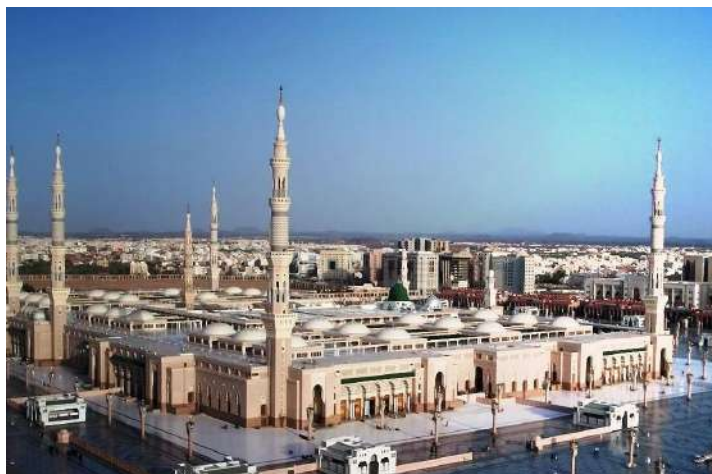
麥地那 :位於沙特境內北部賽拉特山區中，是先知穆罕默德復興伊斯蘭教初期的政治、宗教活動中心，也是其安葬地，與麥加、耶路撒冷一起被稱為伊斯蘭教三大「聖地」。