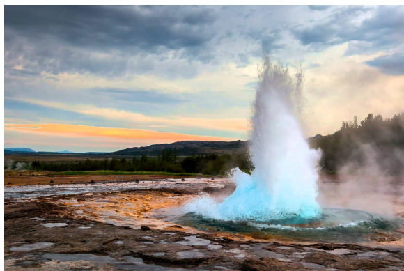
間歇噴泉：每約10分鐘噴發一次，最高可達40米的地熱水柱，已成為各國遊客最期待捕捉的一刻。