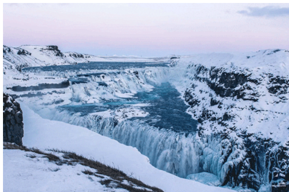
黃金瀑布：源源不斷滾滾流至峽谷內的河水，把瀑布沖刷成兩層，遇到適當光線配合時出現的彩虹，令人感到觸手可碰。