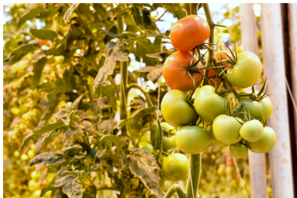
蕃茄農場：Friðheimar是一間以溫室培植蕃茄的農場附設餐廳，蕃茄含水量達90%，冰島的水質天然純淨，這溫室農場所出產的蕃茄比一般更天然新鮮。餐廳除了提供烹調蕃茄料理，自家製的蕃茄雪糕，還有特式飲品如蕃茄啤酒(Tómatbjór)。