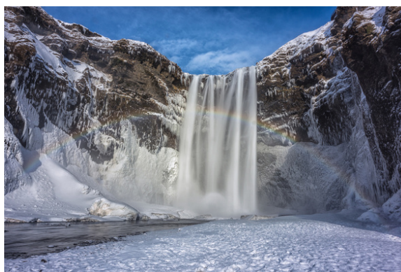
史可加瀑布(彩虹瀑布)：瀑布寬15米，高60米，由於產生的噴霧量多，在陽光明媚的日子可見彩虹或霓虹，故又被稱為「彩虹瀑布」。