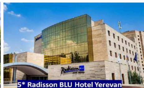
5* Radisson BLU Hotel Yerevan