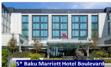
5* Baku Marriott Hotel Boulevard