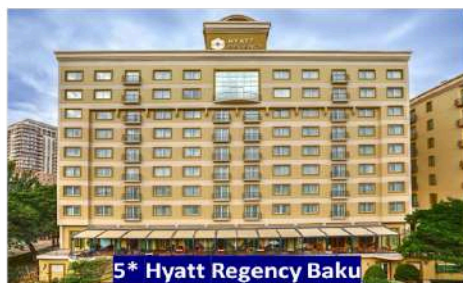
5* Hyatt Regency Baku