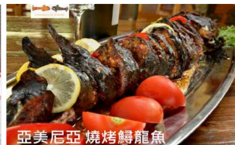
亞美尼亞 燒烤鱈龍魚