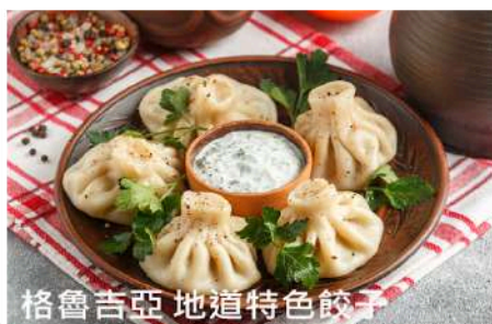
格魯吉亞 地道特色餃子