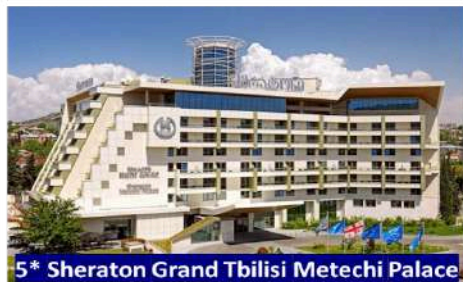
5* Sheraton Grand Tbilisi Metechi Palace