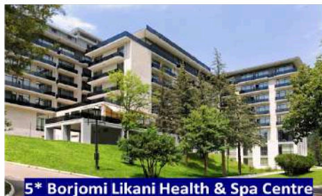
5* Borjomi Likani Health & Spa Centre