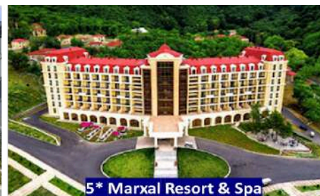
5* Marxal Resort & Spa