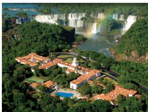
5★ 伊圭蘇瀑布 Belmond Das Cataratas