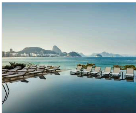
5★ 里約熱內盧 Fairmont Rio de Janeiro Copacabana