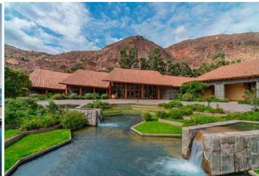
5★ 印加河谷 Tambo Del Inka Resort