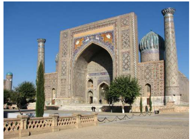
撒馬爾罕 ：古代中亞康國的首府，古稱「花刺子模汗國」，是帖木兒之故鄉。唐朝時與中國有商貿來往，市內古蹟處處，恍如阿拉伯一千零一夜的城市。

Bukhara (High-Speed Train) ~ Samarkand (UNESCO)~ Ulugbek Observatory