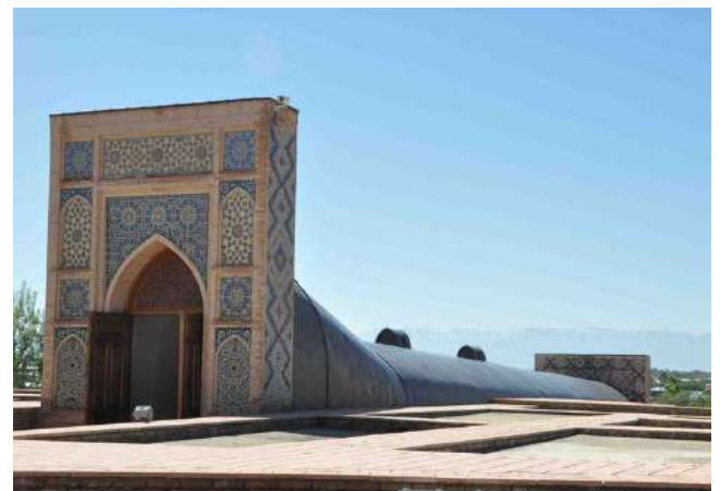
兀魯伯古天文台遺址 ：兀魯伯是帖木兒的孫子，精通天文學，原址安裝了一條巨大的六分儀，曾進行