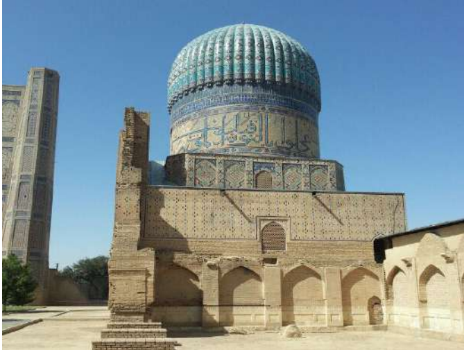
波依卡龍古塔 ：古城內最高建築物之一，有用作崇拜的清真寺。