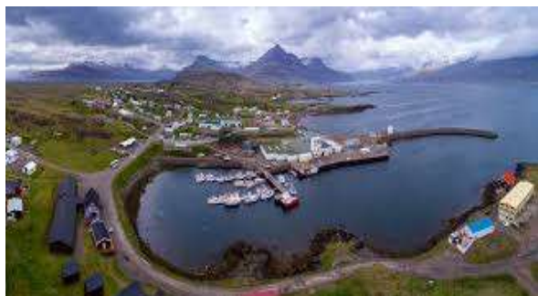
都皮沃古爾：冰島東部漁村小鎮，鎮上以寧靜的峽灣風光與獨特的人文藝術聞名。