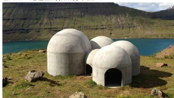
戶外聲音裝置藝術：這座由德國藝術家 Lukas Kühne 於 2012 年打造的混凝土結構，巧妙融合了當地自然景觀與冰島傳統音樂文化。由 5 個大小不同、內部相連的混凝土圓頂組成，代表了冰島傳統的五聲音階。每個圓頂都有不同的共鳴頻率，當遊客在裡面唱歌、說話或發出聲音時，會產生獨特的自然回聲與迴響。