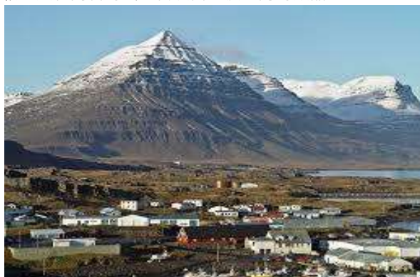
金字塔山：高達 1069 公尺的宏偉火山，因其近乎完美的金字塔形狀與玄武岩柱紋理而成為著名地標。

早餐：郵船上 午餐：郵船上 晚餐：郵船上 住宿：豪華Oceania Insignia 郵輪上