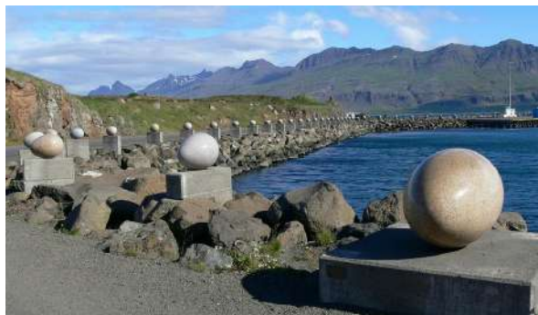
34顆巨型鳥蛋：位於海灣步道，沿著海岸線設立了 34 顆巨大花崗岩鳥蛋，代表當地棲息的鳥類品種。