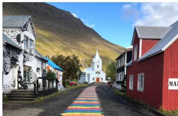
彩虹街與藍教堂：鎮上的地標，通往教堂的街道漆成彩虹圖案，是極佳的拍照打卡點。

Seydisfjordur : 07:00 am Arrival · 05:00pm Depart Shore excursion: Rainbow Street & Seyðisfjörður Church ~ Tvisongur ~ Gufufoss Waterfall ~ Puffin Watching