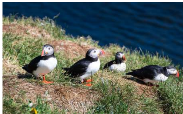
觀賞海鸚鵡：海鸚鵡廣泛視為冰島最具代表性的動物，最佳觀賞季節為每年的 5 月至 8 月中旬。

早餐：郵船上 午餐：當地餐廳 晚餐：郵船上 住宿：豪華Oceania Insignia 郵輪上